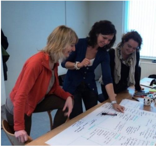
Discussiëren over het verdienmodel

Veranderaanpak voor mensgerichte organisaties